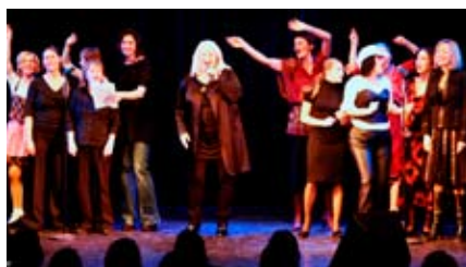
Die Musical Mamis lieferten eine fulminante Show!

Konkret geholfen haben heuer bereits zum vierten Mal die Musical Mamis mit ihrem Auftritt im Wiener Metropol am 16. März.