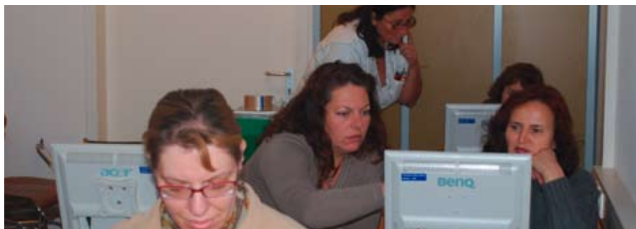
Rauchten bei der Einschulung noch die Köpfe ....

Die neue Pflegedatenbank macht Schluss mit der Zettelwirtschaft.