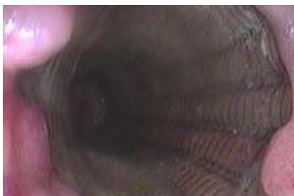
Speiseröhrenstent – endoskopisch

Endoskopie (diagnostisch und therapeutisch) angeboten werden. Richtig durchgeführt, fehlt dem Patienten auch bei längeren und schmerzhaften Eingriffen das Bewusstsein bzw. die Erinnerung daran.