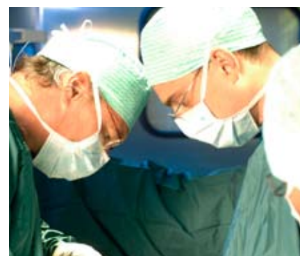
Immer up to date: die Chirurgen des Hauses

Stoffwechsel- und Magenbypass-Chirurgie.