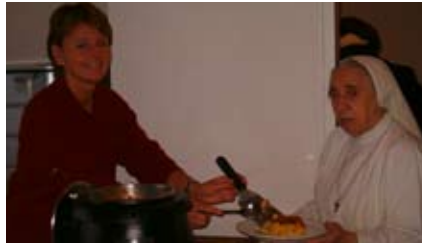
Mitarbeiter, Ehrenamtliche und Schwestern helfen bei der Verköstigung.

420.000 Menschen, also rund 5 % der Bevölkerung, sind in Österreich von Armut betroffen. Um dieser Not entgegenzutreten, startete die Wertegruppe des Krankenhauses die Initiative „Freundschaftsmahl“ vor über einem Jahr. Wir laden zu einer warmen, von der hauseigenen Küche zubereiteten Mahlzeit. Jeden Montagmorgen kümmern sich freiwillige Mitarbeiter aus dem Haus, aber auch externe ehrenamtliche Helfer sowie Ordensschwwestern um das leibliche und seelische Wohl der Gäste. Die durchschnittliche Besucherzahl von 25 Personen in unserem Personalwohnheim in der Alsgasse bestätigt, dass wir den richtigen Weg gewählt haben.