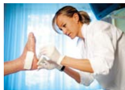
Die kompetente Behandlung der Wunden ist essenziell für die Heilung.

Das „Integrative Wundmanagement“ wurde in der Kategorie „Ambulanter Bereich“ mit dem ersten Platz durch die Stadt Wien ausgezeichnet.