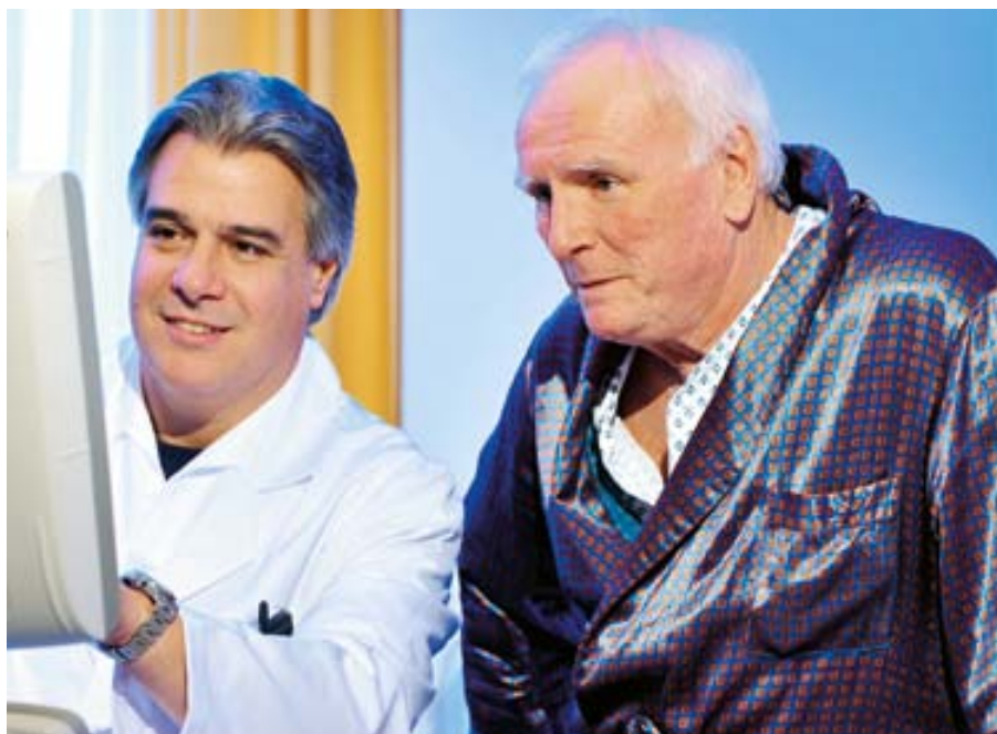
Wir nehmen uns Zeit, um mit den Patienten die Untersuchungsergebnisse zu besprechen.

Harninkontinenz, der unfreiwillige Verlust von Harn, ist nicht nur eine Frauenkrankheit. Auch Männer leiden darunter, meist nach einer vorhergehenden Erkrankung des Urogenitalbereichs. Gerade bei diesem Krankheitsbild gibt es seit kurzem moderne Operationsmethoden, die hier im Haus durchgeführt werden.